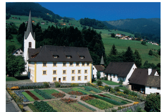
Propstei St. Gerold

Infos zum Haus: www.propstei-stgerold.at